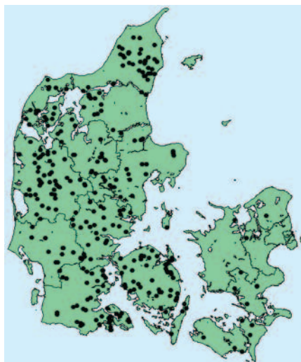
Fig. 2. Localização dos efetivos na Dinamarca com a doença dos edemas entre 2005-2012.

Os critérios de inclusão foram: leitões saudáveis, com mais de 2 dias de vida e peso superior a 800 g.